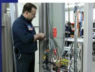
Vue de côté gauche (élévateur seulement)